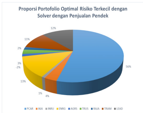
Tabel 3 Set Efisien

Dari tabel 3, dapat diketahui bahwa proporsi paling tinggi adalah PCAR. Lebih dari separuh dari keseluruhan dana yaitu sebesar 56% diinvestasikan untuk PCAR. Dan dari kesembilan aktiva, hanya terdapat satu aktiva yang harus dilakukan short-selling atau penjualan pendek. Aktiva tersebut yaitu AGRS, yaitu sebesar -2%.