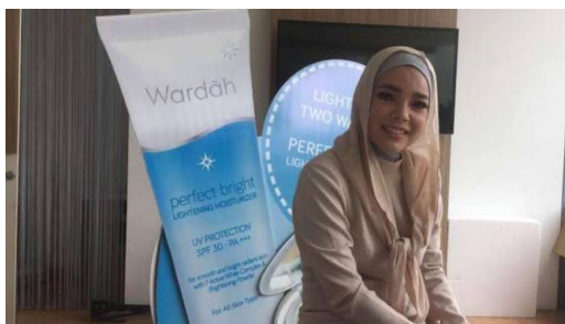
Gambar 1. Dewi Sandra Brand Ambassador Wardah

Cantik secara denotatif di dalam produk iklan wardah yaitu perempuan yang memiliki kulit putih, bebas dari jerawat, bibir tipis dan mata yang indah. Sedangkan makna cantik secara konotatifnya yaitu perempuan yang memakai hijab, memiliki aura positif dan juga pintar (Oktaviani, 2016). Pesan cantik lain yang ingin disampaikan oleh produk wardah yaitu perempuan yang selalu tampil Fashionable , tidak hanya cantik dari luar saja akan tetapi juga cantik dari dalam seperti halnya Dewi Sandra. Hal tersebut dapat di lihat dalam adegan-adegan Dewi Sandra saat mempresentasikan produk wardah di televisi.