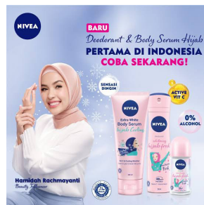
Gambar 6. Produk Kecantikan Merk Nivea

Keenam , produk kecantikan dari Jerman dengan merk Nivea (Novironica, 2014). Produk ini berbeda dengan produk lainnya, jika produk lainnya menawarkan kaum hawa agar kulit menjadi putih, Nivea justru menawarkan agar perempuan berkulit cokelat. Hal tersebut dikarenakan ada berbagai pandangan bahwasanya perempuan yang berkulit coklat itu cantik dan sehat, khususnya pandangnya orang Eropa (Parameswari, 2016). Maka dari itu Nivea menggunakan situasi tersebut untuk mempromosikan produk pencoklat kulit untuk kecantikan perempuan. Sesuatu yang unik dari adegan iklan produk Nivea adalah, dalam tampilan adegan iklannya terdapat model yang memperagakan menjadi seorang "Snow White".