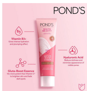
Gambar 5. Produk Kecantikan merk Ponds

Ketiga adegan tersebut dapat disimpulkan bahwasannya kesan yang ingin disampaikan oleh produk Ponds yaitu orang yang berkulit putih dapat meraih cita-citanya, tambah disayang oleh suaminya dan tambah percaya diri sehingga disukai banyak orang. Adegan-adegan dari produk Ponds tersebut apabila dianalisis menggunakan Semiotikanya Ronald Barthers maka itu menunjukkan mitos belaka. Dikarenakan belum tentu juga perempuan yang berkulit putih selalu menang dalam audisi, menjadi pusat perhatian dan belum tentu juga tambah disayang oleh suaminya.