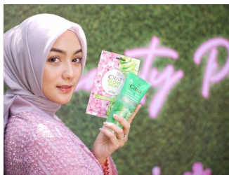
Gambar 4. Citra Kirana Sebagai Brand Ammbasador Produk Citra