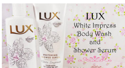
Gambar 3. Produk Kecantikan Lux

Iklan Lux di televisi juga diperagakan oleh lima perempuan cantik yang memakai gaun dan aksesoris yang putih. Apabila diamati lagi, adegan iklan Lux tersebut menunjukkan makna Konotatif yaitu bahwasannya perempuan yang berkulit putih harus berkumpul dengan wanita berkulit putih juga. Berkumpul dalam hal ini dalam suatu perayaan atau bisa juga berteman dalam kehidupan sehari-hari. Iklan tersebut seolah olah menunjukkan sikap rasisme terhadap perempuan yang berkulit hitam. Sedangkan kata “ White Impress Body Wash and Serum ” apabila dianalisis dengan Semiotikanya Roland Barther itu adalah suatu mitos, dikarenakan kata tersebut menunjukkan bahwasannya kulit putih itu mengesankan.