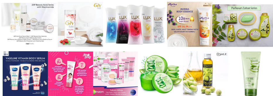
Gambar 7. Macam-macam Produk Kecantikan

LUX, GIV, ZAP beauty, dan lainnya. Tentunya dengan slogan dan pesan-pesan yang berbeda. Misalnya saja sabun lux dengan slogan “ Play With Beauty ”. Sedangkan ZAP beauty sendiri juga melakukan survey yang menunjukkan rata-rata 59,5% perempuan yang ada di Indonesia menginginkan produk kecantikan yang dapat mencerahkan kulit.