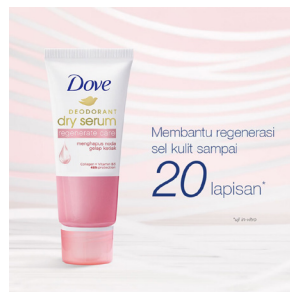
Gambar 7. Produk Kecantikan Dove

Ketujuh , produk kecantikan dari Inggris dengan merk Dove. Menurut lembaga survey Internasional yang dilakukan oleh produk Dove menunjukkan, bahwasanya hanya 4% perempuan di seluruh dunia yang menganggap diri mereka itu “cantik”, 11% anak perempuan yang merasa nyaman menggambarkan diri mereka sebagai “cantik”, 72% gadis merasakan tertekan untuk menjadi “cantik”, 80% perempuan setuju bahwa dalam dirinya ada sesuatu yang indah, tetapi tidak melihat kecantikan dalam dirinya, dan lebih dari 54% perempuan di dunia setuju bahwa kecantikan dirinya itu tergantung penilaian orang lain. (Casmini, 2019)