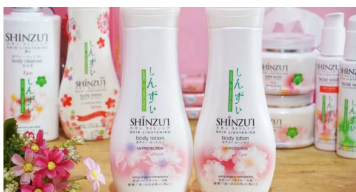
Gambar 8. Produk Kecantikan Shinzhui

Kedelapan , produk kecantikan dengan merk Shinzhui. Dalam iklannya Shinzhui menyebutkan bahwasannya “Putih itu Cantik”. Makna denotatifnya yaitu sesuatu yang berwarna putih adalah cantik. Makna konotatifnya yaitu orang yang berkulit putih itu pasti cantik, dan orang yang berkulit tidak putih belum tentu cantik. Sehingga apabila seseorang ingin cantik maka kulitnya harus putih, dan kulit bisa putih maka harus memakai sabun Shinzhui.