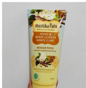
Gambar 2. Produk Mustika Ratu merk “Hand & Body Lotionwhite Care”