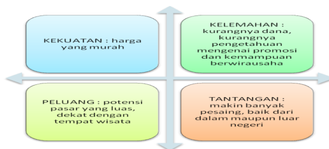
Tabel 1. Analisis SWOT UMKM Desa Nglebak

Untuk mengetahui tantangan dan kendala yang dihadapi oleh UMKM yang berada di Desa Nglebak, dapat dilakukan dengan melakukan analisis SWOT. Analisis SWOT merupakan analisis terkait strength (kekuatan), weakness (kelemahan), opportunity (peluang), dan threat (tantangan). Dengan melakukan analisis ini, dapat diketahui bagaimana kekuatan dan peluang yang dimiliki oleh UMKM Desa Nglebak yang perlu dipertahankan dan ditingkatkan, serta kelemahan dan tantangan yang perlu diatasi. Dari tabel 1 dapat dilihat bagaimana analisis SWOT yang diterapkan untuk UMKM Desa Nglebak.