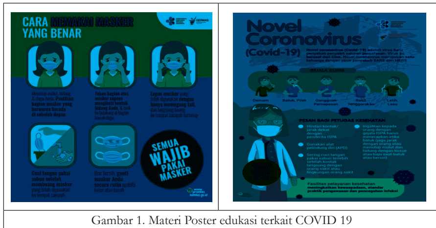
Gambar 1. Materi Poster edukasi terkait COVID 19

Kegiatan yang kedua yaitu pembuatan video 6 langkah mencuci tangan dengan benar. Jenis kegiatan ini merupakan terusan dari sosialisasi covid-19 dengan memanfaatkan media yang berbeda. Media yang digunakan yaitu berupa video pendek berdurasi sekitar 4 menit. Dalam video tersebut berisikan mengenai 6 langkah cara mencuci tangan yang dilengkapi dengan panduan berupa transkrip pada video serta penjelasan dengan suara. Agar lebih menarik video 6 langkah mencuci tangan tersebut dikemas dengan singkat dan jelas serta disisipi dengan audio yang menarik. Audio tersebut dimaksudkan agar penonton video tidak bosan dan lebih menikmati serta memahami apa yang diamanatkan dalam video tersebut. Hal tersebut di sosialisasikan melalui media sosial diantaranya yaitu whatsapp , facebook , instagram dan youtube . Melalui media whatsapp dengan memanfaatkan adanya fasilitas story serta grub-grub yang ada. Salah satu grub yang menjadi sasaran utama yaitu grub belajar dukuh Sulicilik. Sosialisasi kali ini lebih memanfaatkan media sosial karena jangkauannya lebih luas dan efektif serta efisien.