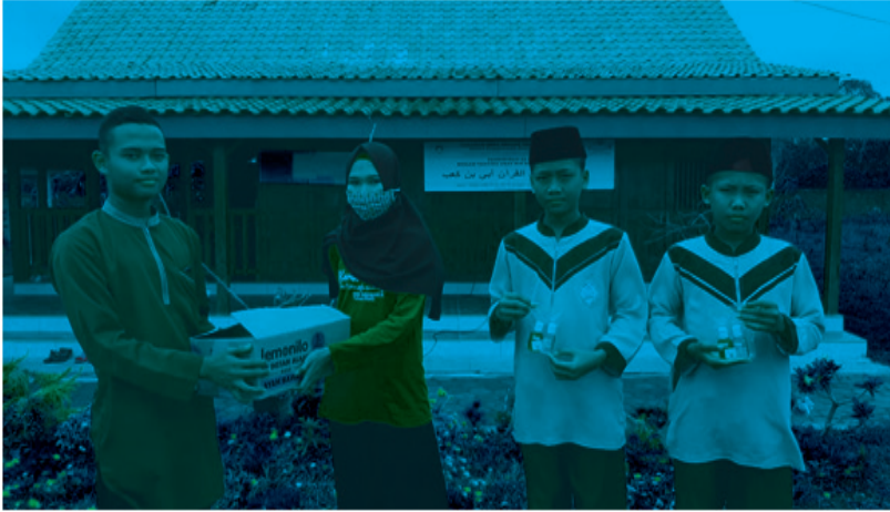
Gambar 4. Aksi sosial berupa pembagian Handsanitizer serta handsoap