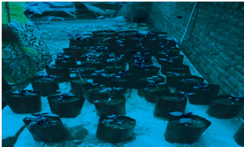
Gambar 3. Bercocok tanam berbagai sayuran dalam “Gerakan Warung Sehat”

Kegiatan keempat yaitu, pembagian handsanitizer dan handsoap. Kegiatan ini merupakan salah satu sosialisasi berupa aksi sosial kepada masyarakat. Tujuan dari aksi sosial tersebut adalah memutus mata rantai penyebaran covid-19 mulai dari diri sendiri yaitu dengan rajin mencuci tangan menggunakan sabun dan langkah-langkah yang benar serta menggunakan hansanitizer jika diperlukan. Aksi sosial tersebut merupakan salah satu bentuk kepedulian atau pengabdian kepada masyarakat. Sasaran dari kegiatan tersebut yaitu warga dukuh Sulicilik dan santri-santri di pondok pesantren yang ada di dukuh sulicilik, Jebugan, Klaten Utara, Klaten.